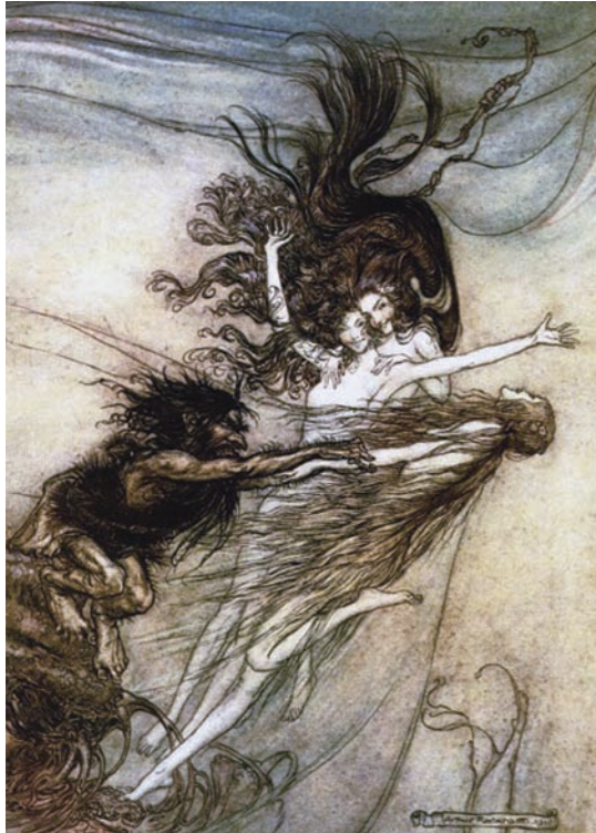
挿絵:アーサー・ラッカム (イギリス) 1867-1939